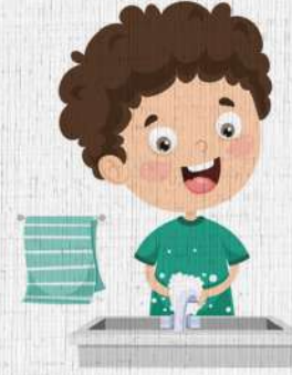
ہاتھ صاف رکھیں